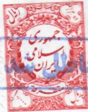
غیر قابل انتقال

شماره: ۱۰۰۶۷/۱۰۰۳/ض/۱۴۰۳ تاریخ: ۱۴۰۳/۰۲/۰۳